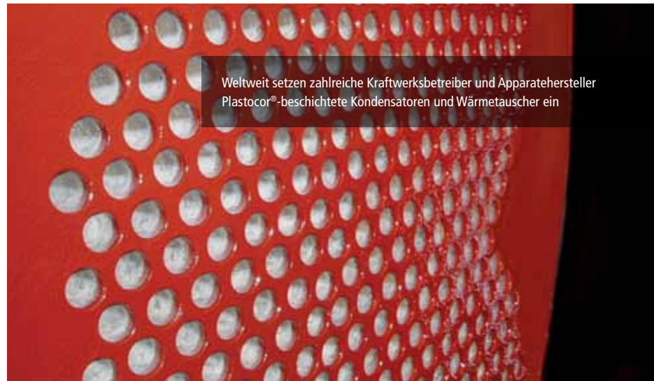
Weltweit setzen zahlreiche Kraftwerksbetreiber und Apparatehersteller Plastocor®-beschichtete Kondensatoren und Wärmetauscher ein

Eine der Hauptursachen für Schäden an Rohrböden von Kondensatoren und anderen Wärmetauschern ist Lochfraßkorrosion durch galvanische Elementbildung. Sie führt zu Undichtigkeiten an den Walzstellen und damit zur Betriebsstörung. Gerade bei bereits stark korrodierten Rohrböden