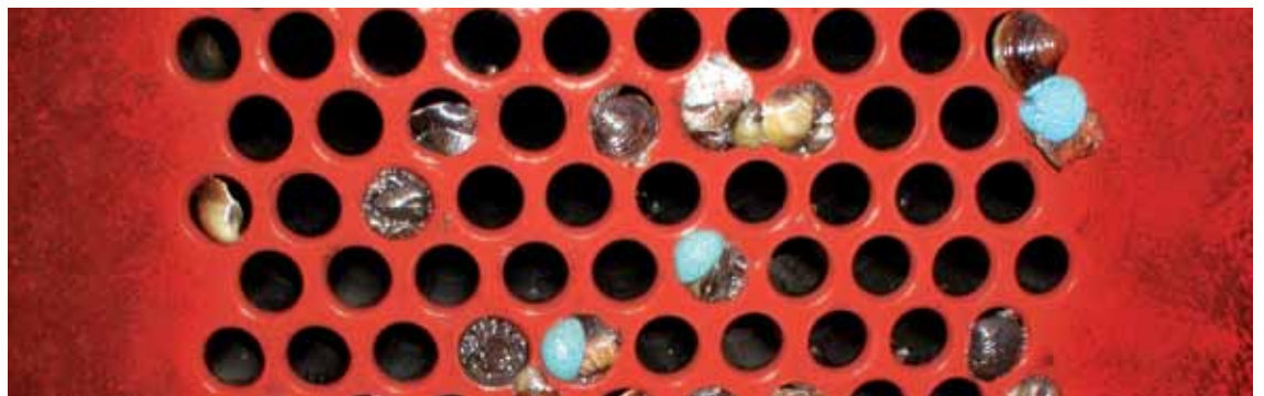
Hervorragende Langlebigkeit auch unter extremen Bedingungen, z. B. bei See- oder Brackwasser

Seit 1958 hat sich Plastocor® im Dauerbetrieb in mehreren hundert Anlagen hervorragend bewährt