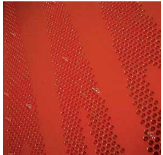
Plastocor® Inlet-Beschichtung bei Rohreintritten