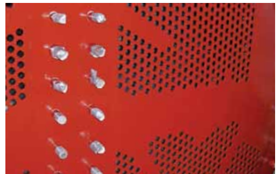
Ein mit Plastocor® 2000 optimal geschützter Rohrboden