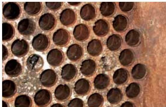
Galvanische Korrosion an einem ungeschützten Rohrboden

ca. 3 bis 5 mm stark aufgetragen. Der Kern des Verfahrens, der die hohen Schichtdicken am Rohrboden ermöglicht, sind die von uns entwickelten „Spachtelstopfen“, die mit einem konischen Kopf die Negativform der fertigen Beschichtung bilden. Je nach Größe des Rohrinne Durchmesser werden entsprechende Stopfen verwendet.